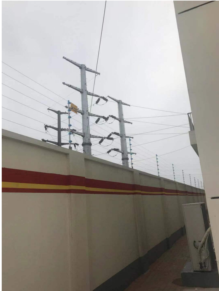
2回 35kV 架空进线