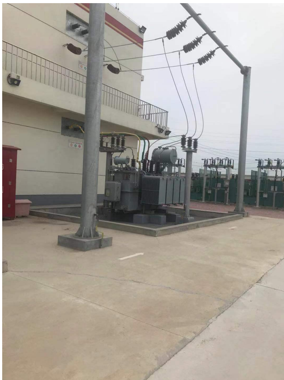
35KV 变压器、6kv 电容器

项目噪声主要为变压器、配电装置等设备运行时产生的噪声，噪声值为60~75dB（A）。设备采用低噪声设备，经过厂界隔声、距离衰减后，对周围声环境质量影响较小。