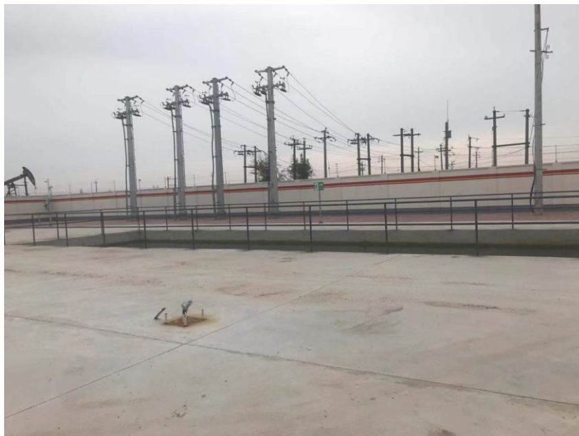
消防水池及 6kV 架空出线