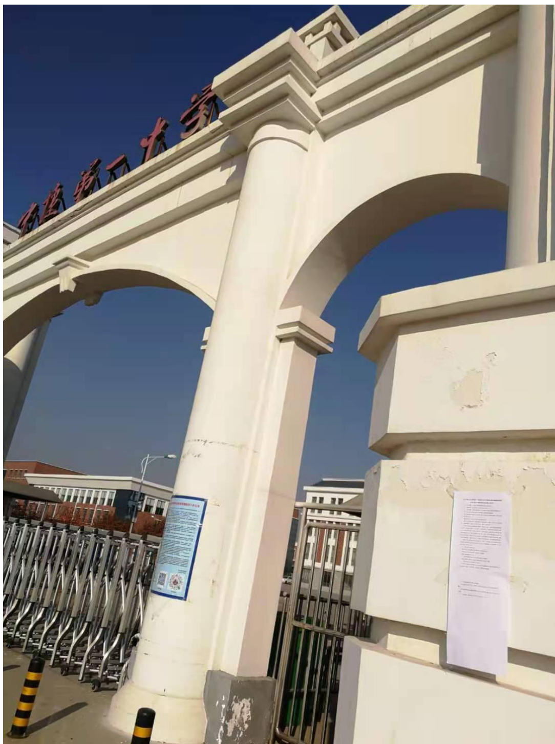
图3 在中捷第一中学公告照片