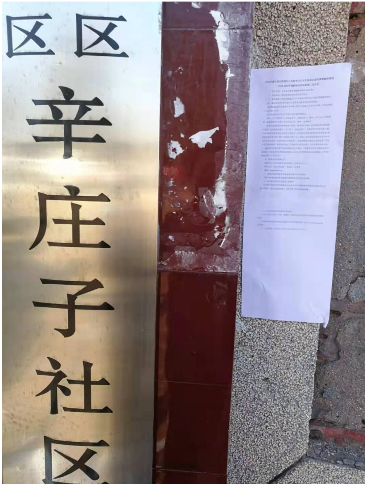
图4 在辛庄子村公告照片