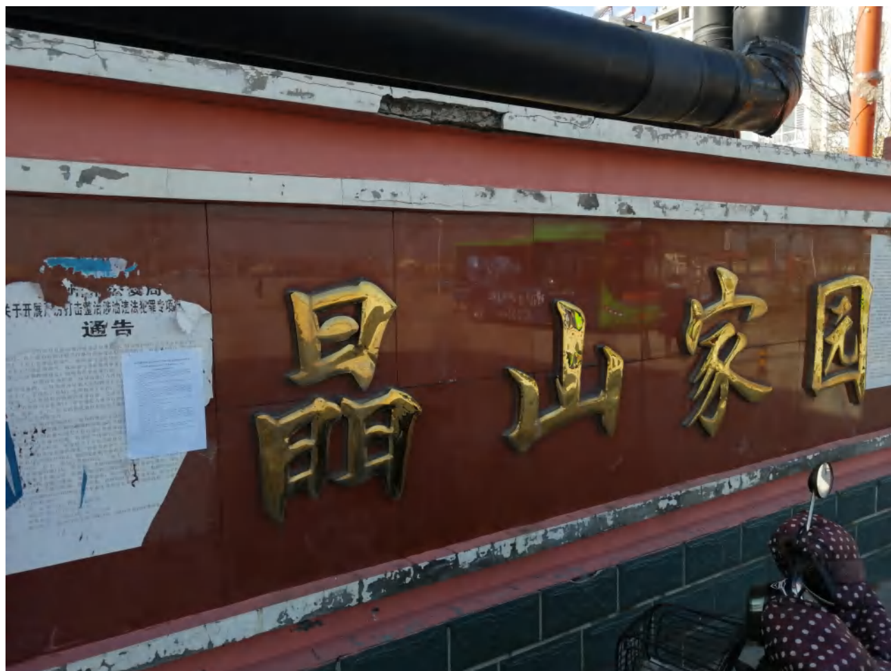
图 2 在盐场新村公告照片

建设单位于 2021 年 1 月 3 日在盐场新村、大郭庄、临港区盐场中心学校（现中捷第二中学）、海滨幼儿园进行张贴第二次环评信息公告。