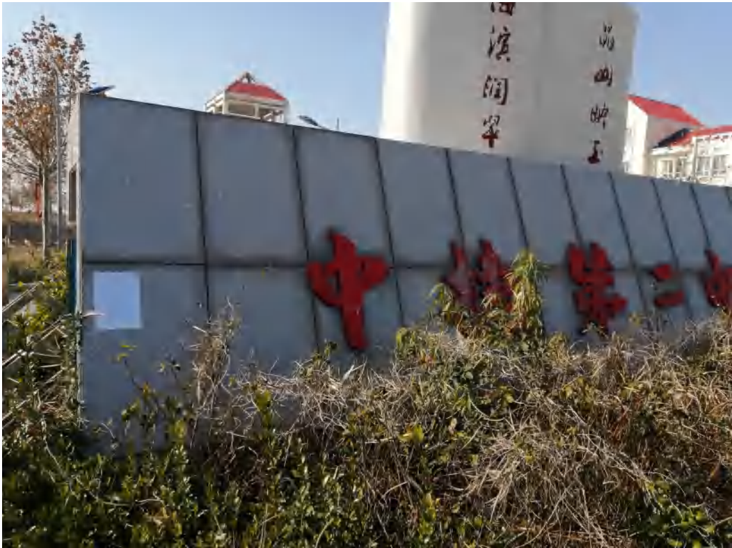
图 4 在中捷第二中学公告照片