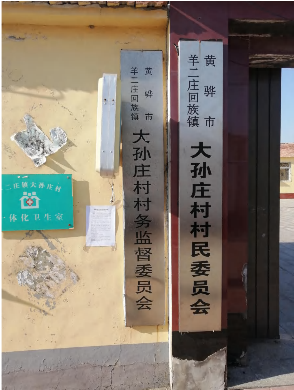
图3 在大孙庄村公告照片