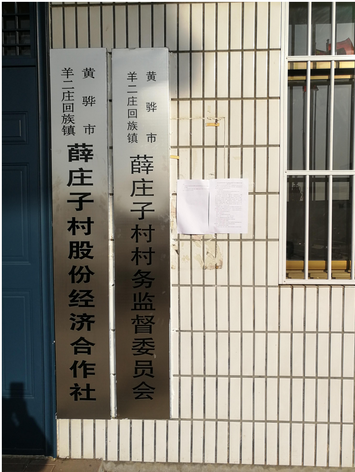
图 2 在薛庄子村公告照片