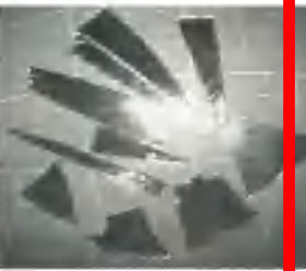
调整了镜片的方向,那枚长约4厘米,上面刻有“3000”字样的镜片,在镜框内。医生表示,该镜片为钢化玻璃,吞下后可能划伤消化道,建议尽快取出。经手术取出后,未发现其他异常。

【本报讯】通讯员 王 近日,沧州市公安局接到群众举报,称有外地女子被骗来沧,被关在传销窝点。为逃出传销窝点,该女子将化妆镜掰碎吞下。经医院抢救,目前生命体征平稳。警方提醒,市民要提高警惕,谨防上当受骗。